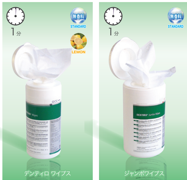
デンティロ ワイプス